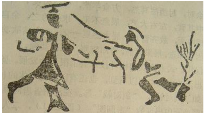
河南省鄭州新通橋 漢代の墓石から出現した「対刺図」