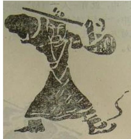
漢代の舞劍の形象