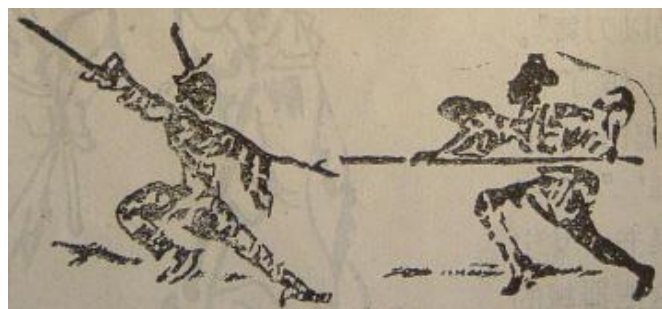
南陽漢画石中、一人が長い槍を持ち「弓歩直刺」もう一人は退ぞき振り返りながら相手を注視している。一進一退、歩法は協調し「対練」を表演している。