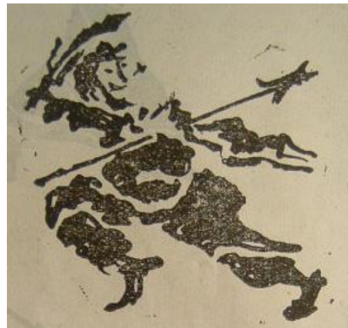
秦漢の百戦の時代、四川郫縣に出土した石棺に掘られた「漫衍水戦」の中の一人「舞鉞」の様子