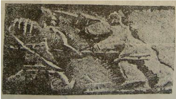
成都から出土した「対刺図」