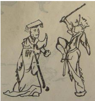
漢末、古沂南墓に彫られた武士舞劍の画面