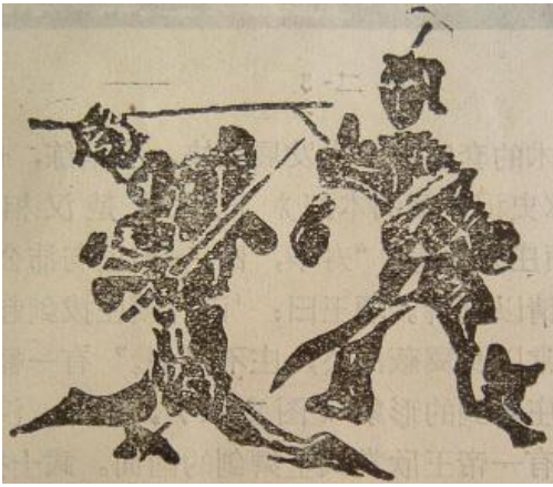
河南省唐河縣石墓から出現した「撃刺図」